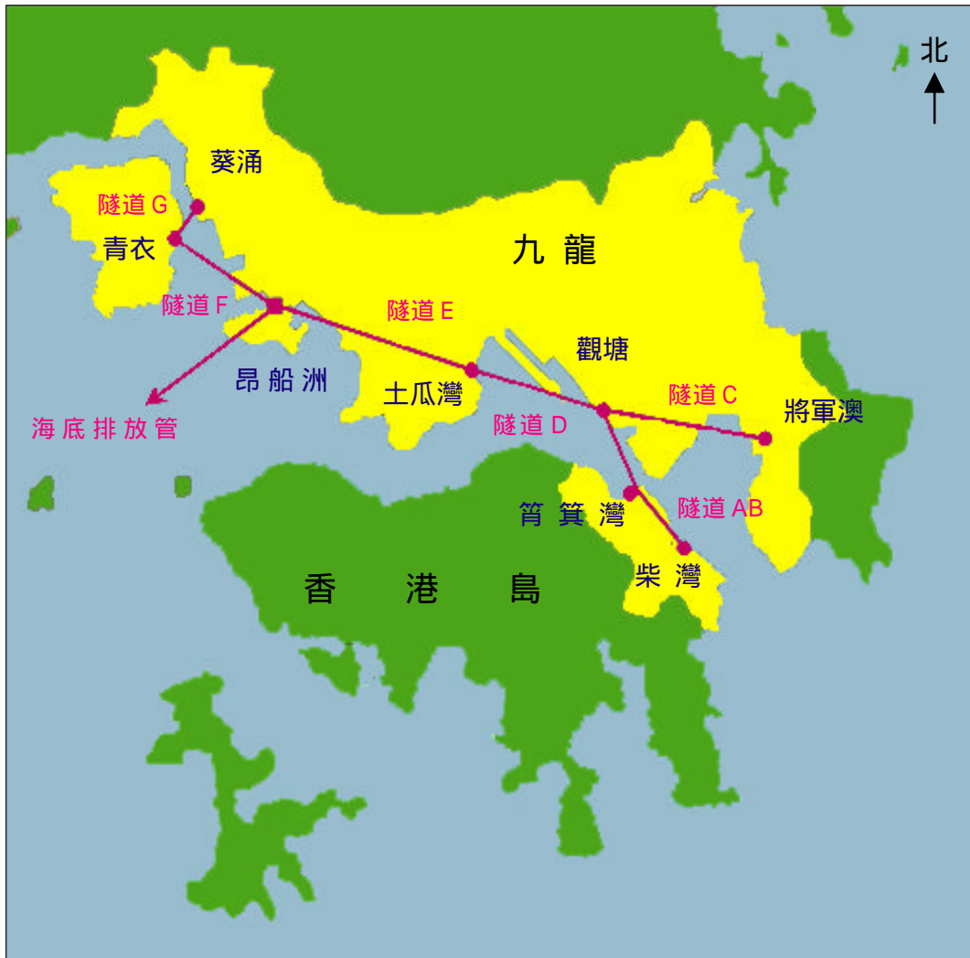
圖例：■ 淨化海港計劃第一期集水區