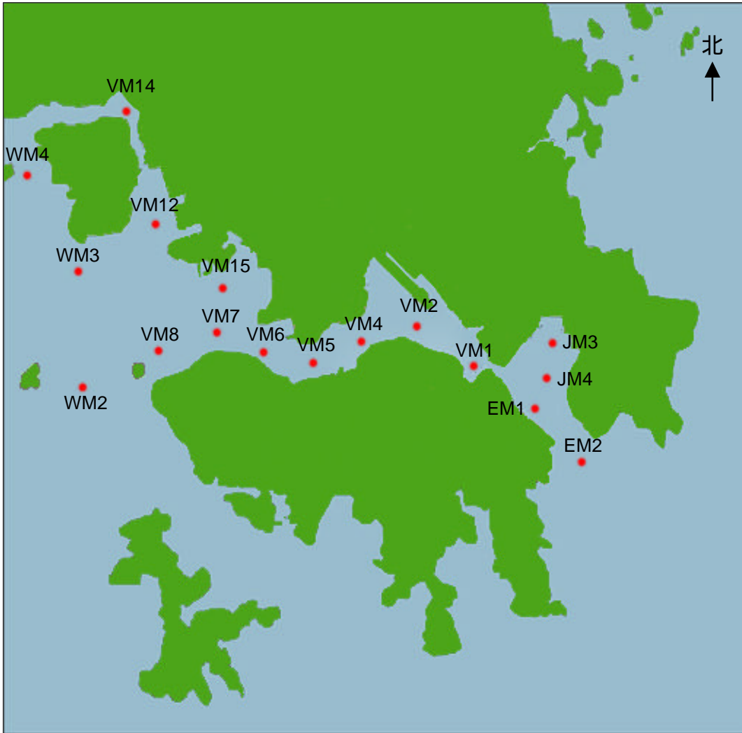
維多利亞港水質監測站位置圖 (參閱第 5.6 段)