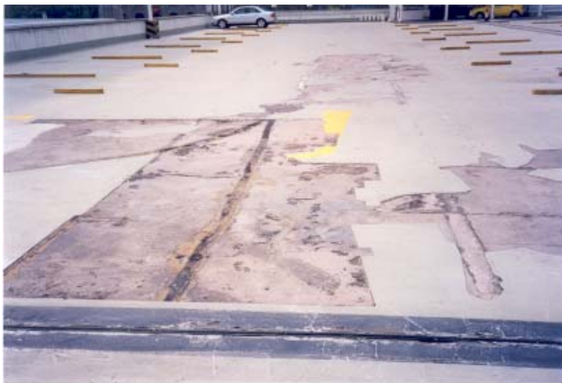
該大廈受損的天台面層物料