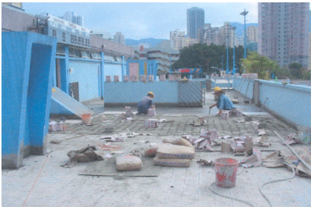
游泳池的翻修工程