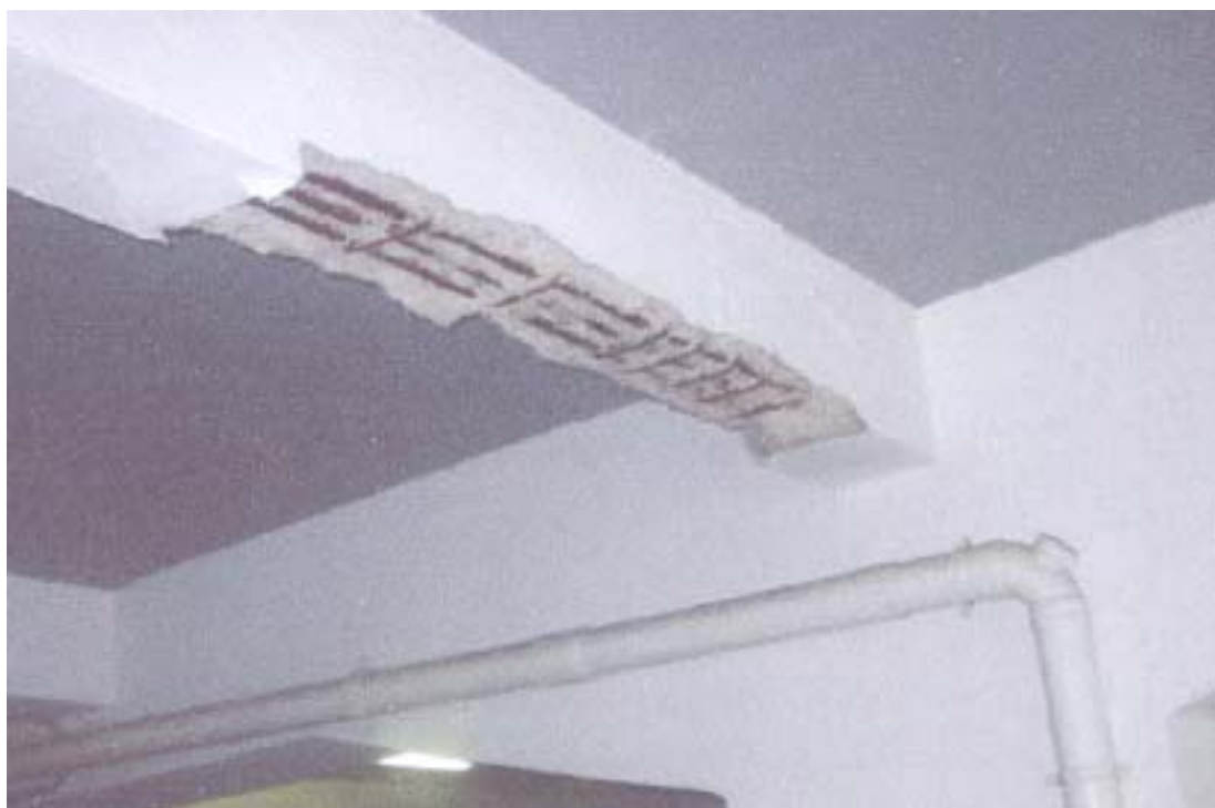
天花混凝土剝落和鋼筋外露