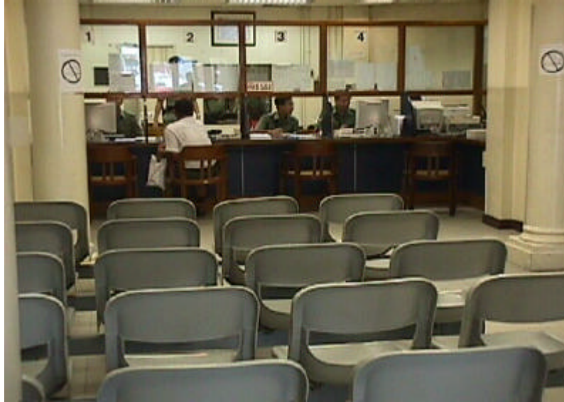
油麻地警署報案室 (警署改善計劃推行前)