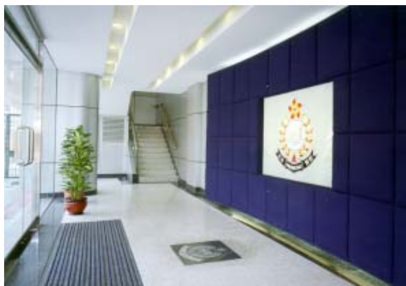
沙田警署大堂 (警署改善計劃推行後)