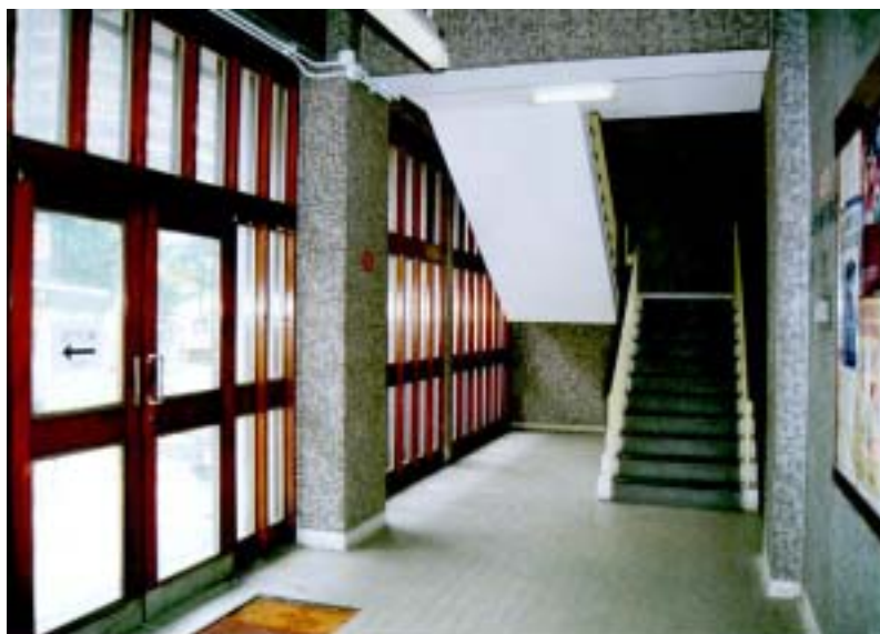
沙田警署大堂 (警署改善計劃推行前)