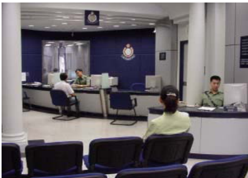
油麻地警署報案室 (警署改善計劃推行後)